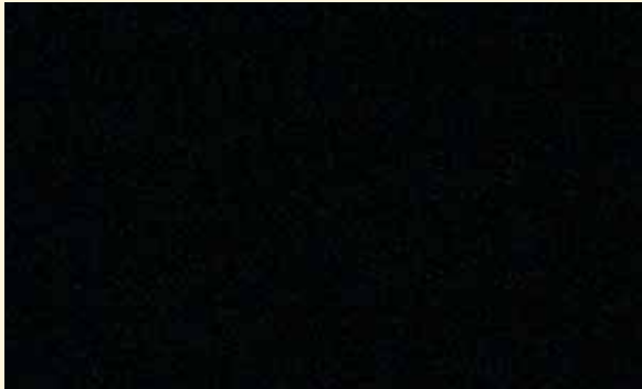
Brilliant Black Crystal Pearl