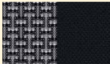
Dark Slate Gray