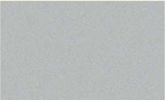
Bright Silver Metallic